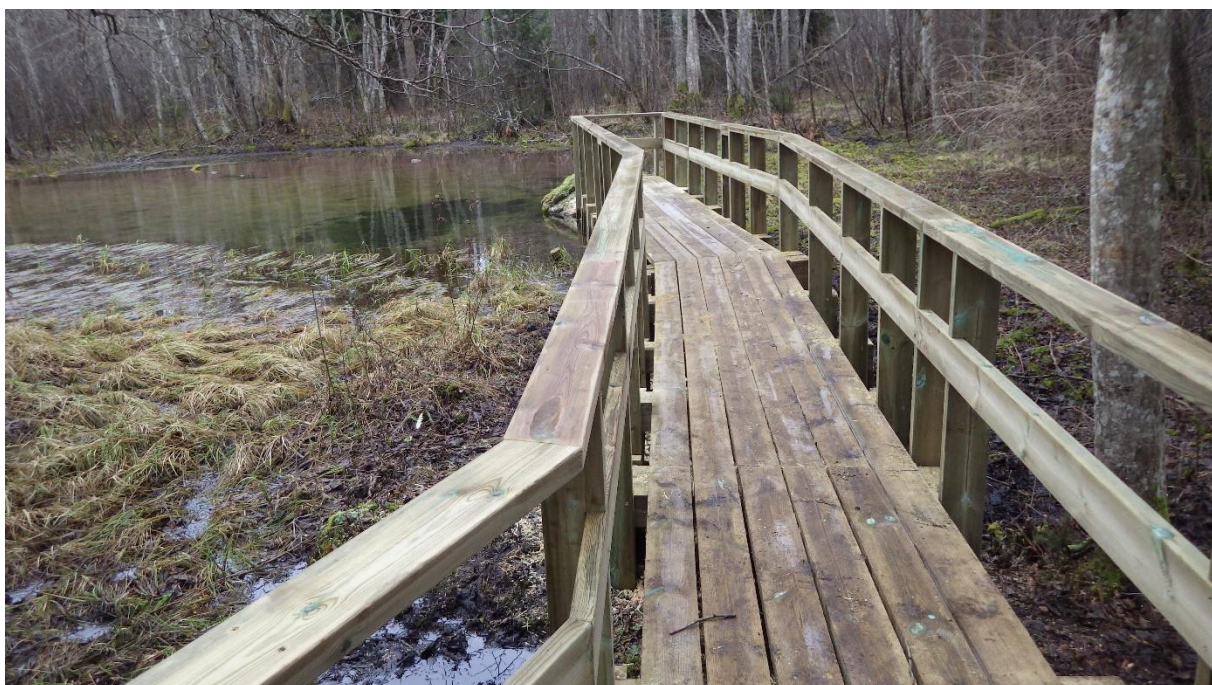
Allika matkarada, Suurallikas, detsember 2016

Allika matkaraja rekonstrueerimise ja laiendamise ehitustööd on alustatud.