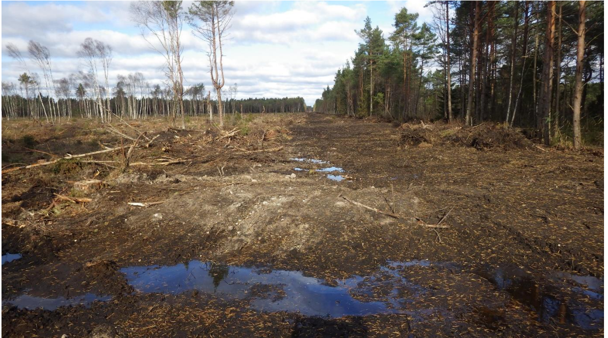
Suletud kraav ja raadatud ala, Viidumäe, oktoober 2016

Suuremad tööd hüdroloogilise režiimi taastamiseks on lõpetatud. Kokku sulgeti kas osaliselt või täielikult ligikaudu 3 km kraave, sealhulgas kõige olulisem negatiivse mõjuga kraav pikkusega 1,6 km Suurissoos. RMK raadas nimetatud kraavi mõjualale kasvanud metsa kokku 10 hektarilt, et luua eeldused soolupaikade taastumiseks.