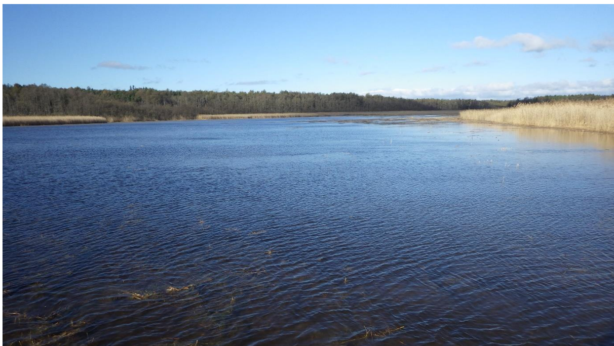
Prästvike järve lõunaosa, oktoober 2016

Allika matkaraja rekonstrueerimise ja laiendamise ehitustööd on alustatud.