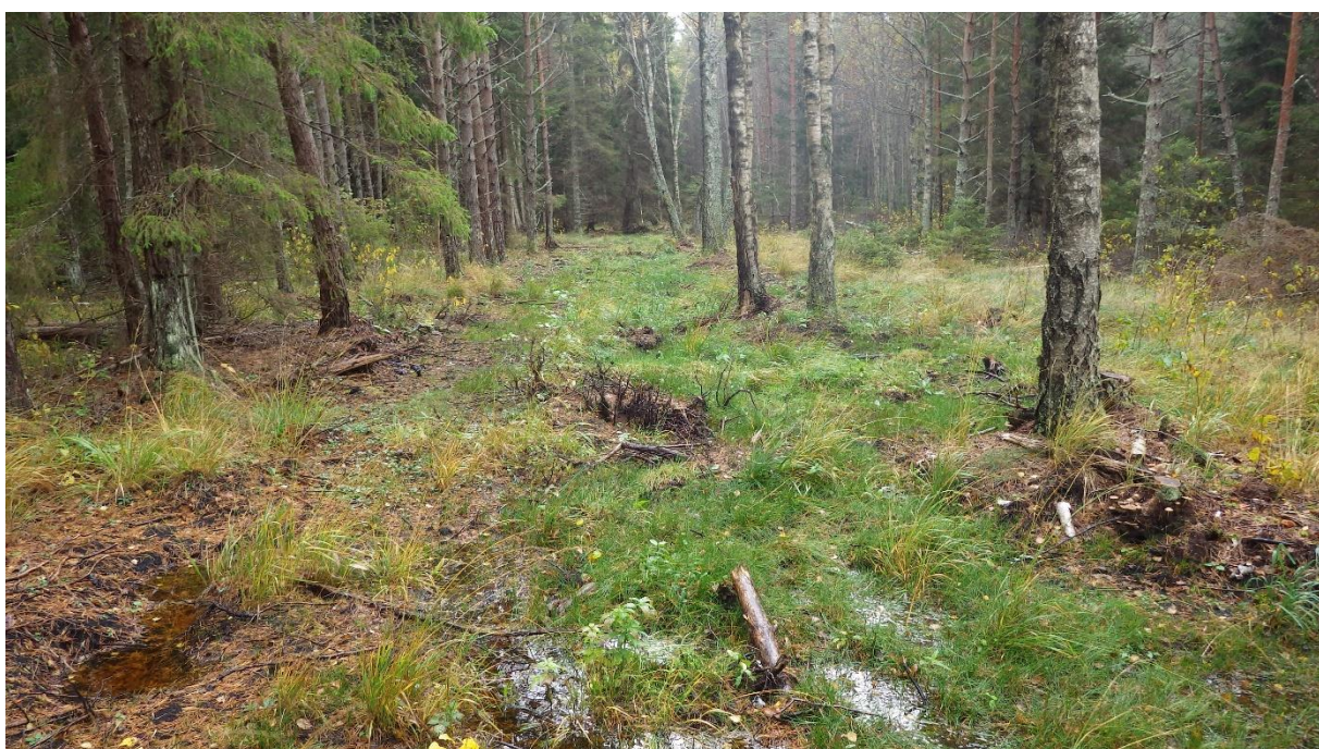
Likvideeritud kraav, paremal üksikud puud endisel kraavimuldel