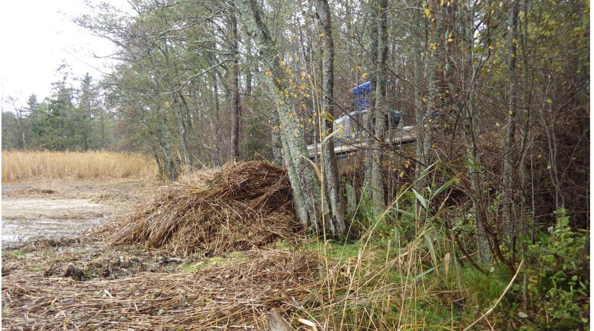
Kokku kogutud roog Prästvike järve põhjakaldal, oktoober 2017

Prästvike järve hooldustööd jätkusid 2017. aastal. Peamiselt puhastati järve põhjaosa ja korrati roo eemaldamist varasematel aastatel hooldatud aladelt. Lõigatud taimestik koguti laoplatsile järve põhjakaldal, kust äravedu toimub soodsate ilmade (külmade) saabudes.