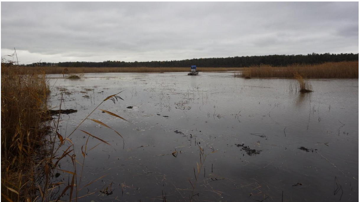
Taasavatud Prästvike järve põhjaosa, oktoober 2017