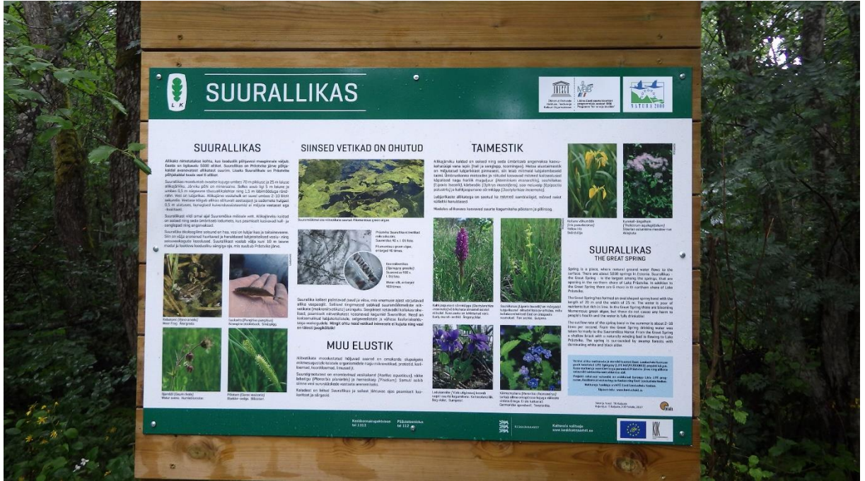
Allika matkarada, Suurallika infotahvel