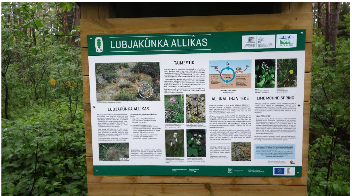
Allika matkarada, Lubjakünka e. Raviiallika infotahvel