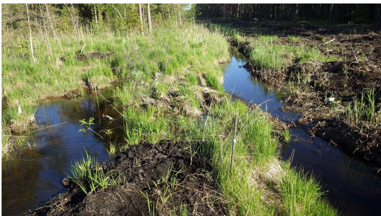
Soolalt (vasakul) väljavoolavad ojad on suletud. Paremalt tõkestatud endine kraav