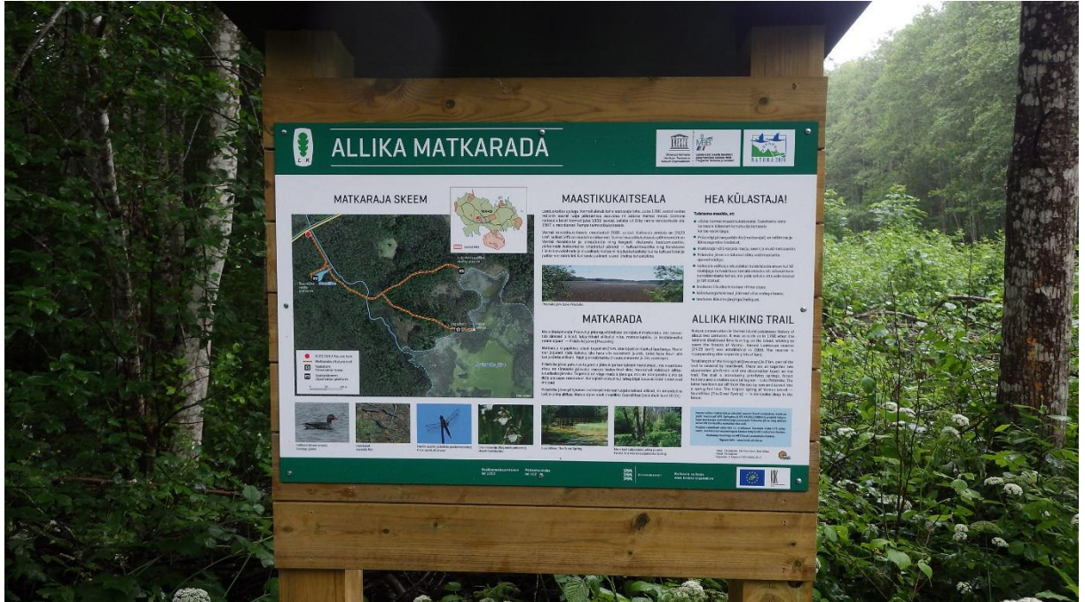
Allika matkaraja algus

Allika matkaraja rekonstrueerimise ja laiendamise ehitustööd on lõpetatud. Rada on ligikaudu 1,9 kilomeetrit pikk, vaadetorni, kahe platvormi ja nelja infotahvliga. Kasutusloa taotlus on esitatud, eeldatavasti väljastatakse kasutusluba veel 2017. aastal. Raja pidulik avamine on kavandatud 2018. aasta maikuuks, mis on ühtlasi looduskaitsekuu ja tähistatakse ka EL Loodusdirektiivi ja LIFE programmi aastapäevi.