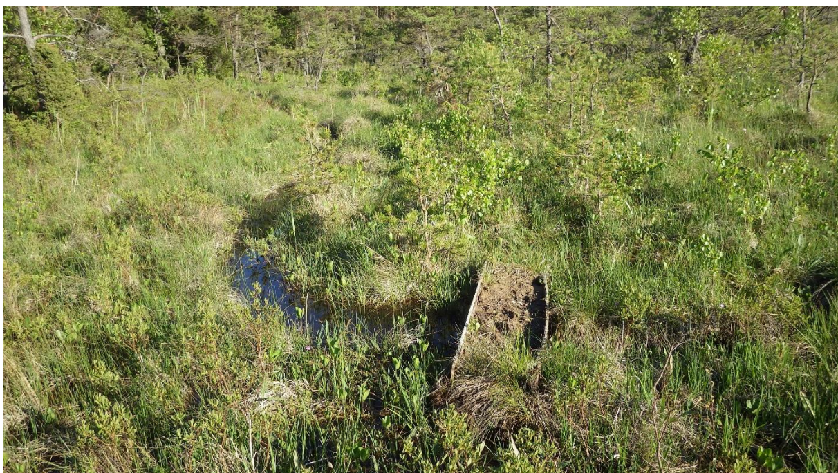
Väiksem puidust voolutõke