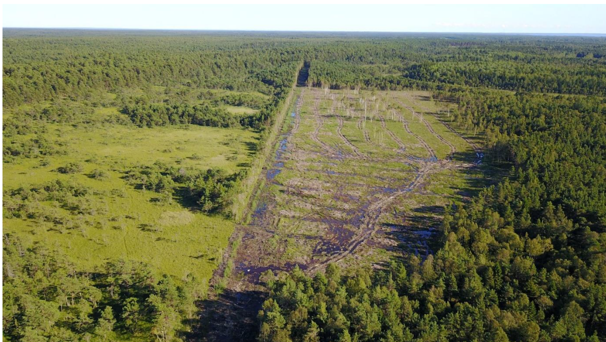
Likvideeritud kraav ja raadatud endine soolupaik Suurissoos, september 2017