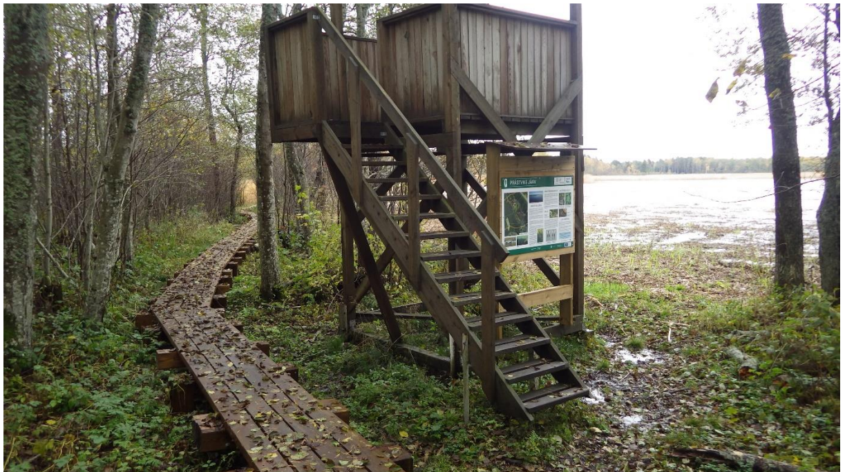
Allika matkarada, vaatetorn Prästvike järve põhjakaldal