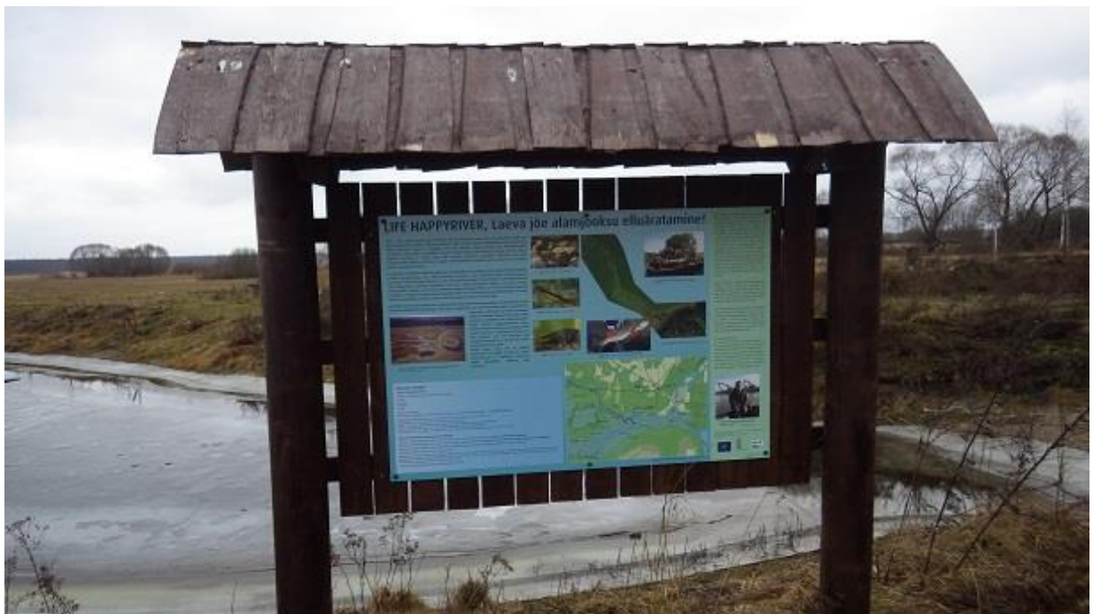
Foto 2. Projekti infotahvel Ihamaakingul