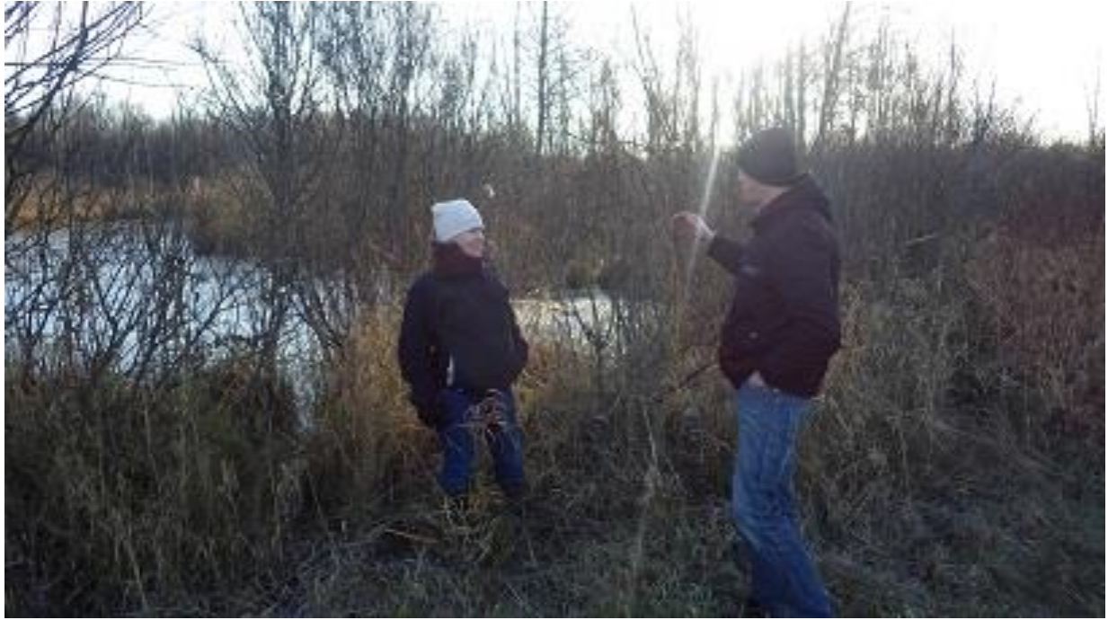
Foto 1. Karisto oja, 23.10.2014 a. toimunud ülevaatus