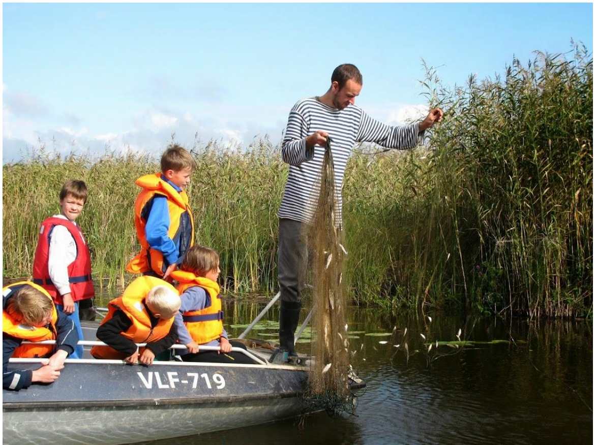
Foto 4. Laste õppelaager Palupõhjas, august 2014